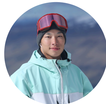
木村 葵来 選手 プロスノーボーダー

岡山市出身。2026年2月ミラノ・コルティナダンペッツォ五輪の『スノーボード男子ビッグエア』で見事金メダルを獲得。日本スノーボード界の歴史を塗り替える壮大な快挙を成し遂げました。