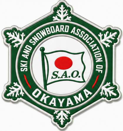
3. グリーン×ホワイト (自然・爽やか)