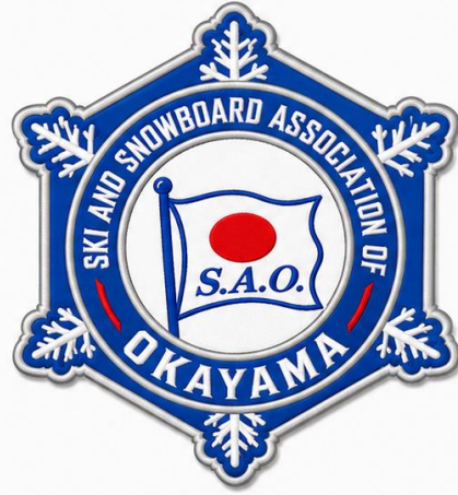
2. ブルー×シルバー (爽やか・スポーティー)