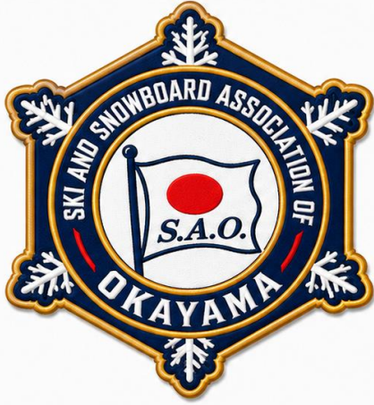
1. ネイビー×ゴールド (定番・高級感)